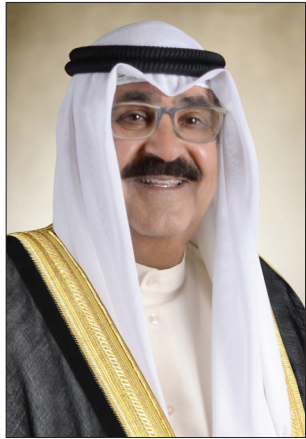
سمو الشيخ مشعل الأحمد الجابر الصباح ولي العهد