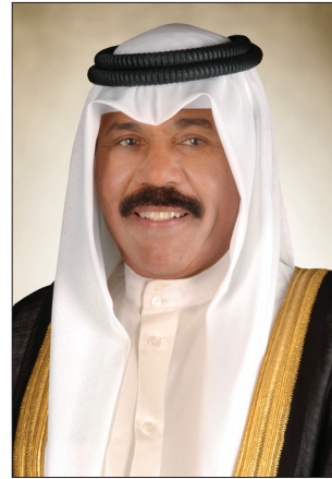
حضرة صاحب سمو الشيخ نواف الأحمد الجابر الصباح أمير دولة الكويت